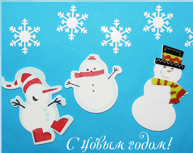
Рисунки сделаны детьми из детских домов