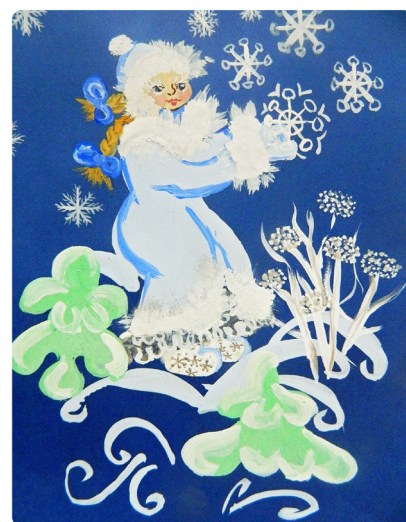
С Новым годом!